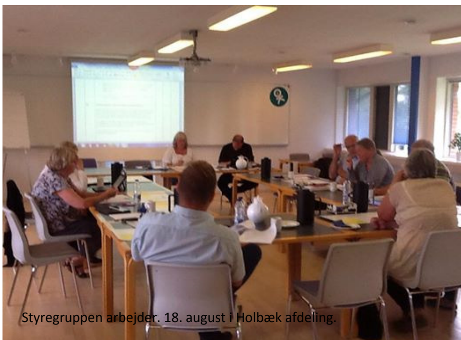
Styregruppen arbejder. 18. august i Holbæk afdeling.

I øjeblikket arbejder de forskellige bestyrelser med at forberede deres svar på, hvorvidt afdelingen fortsat er en del af projektet. I sidste nummer af fusions-nyt var der derfor en del materiale til dette arbejde.